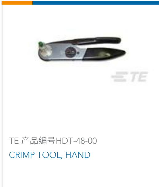
TE 产品编号HDT-48-00 CRIMP TOOL, HAND