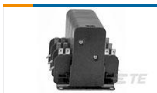
TE 产品编号1618011-2 FM200AAXX=FLATMAN 3-POLE (MS)