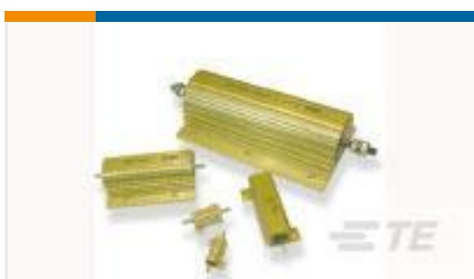
TE 产品编号6-1625984-5 HSA50 50K 5%