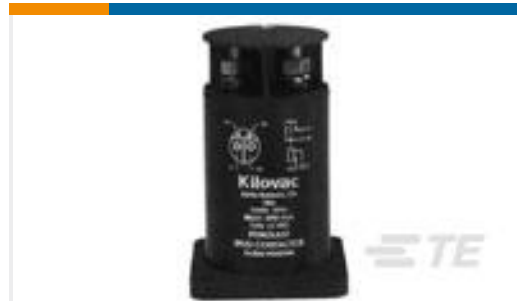
TE 产品编号 7-1618013-4 PD90XC57=RELAY, VACUUM, SPST-N