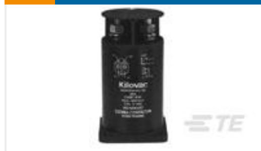
TE 产品编号 1-1618013-4 PD150XB57=RELAY, VACUUM, SPST-