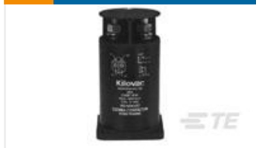
TE 产品编号 1-1618013-3 PD150XA57=RELAY, VACUUM, SPST-