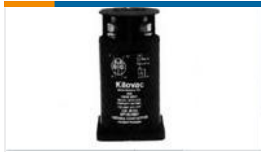
TE 产品编号 6-1618006-6 AP150XB57=RELAY, VACUUM, SPST-