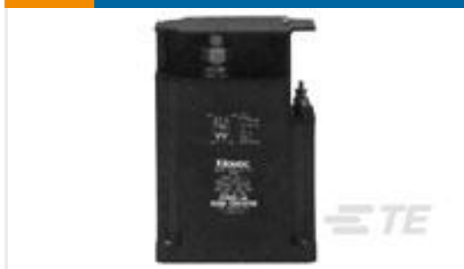
TE 产品编号 4-1618002-8 EV500-5A=RELAY, PRESSURIZED, S