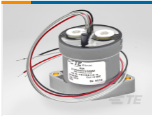
TE 产品编号 5-1618413-0 EV600HVANM = CONTACTOR, SPST- NO 12V COIL