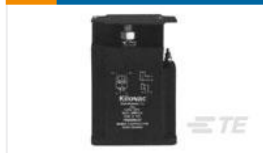
TE 产品编号 2-1618013-6 PD350XB57=RELAY, PRESSURIZED,