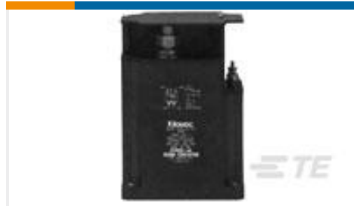
TE 产品编号 4-1618002-4 EV500-4A=RELAY, PRESSURIZED, S