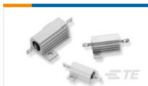
TE 产品编号1-1879363-1 THS75 100R 5%