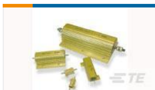
TE 产品编号1625984-8 HSA50 12R 5%