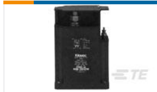
TE 产品编号 4-1618002-5 EV500-4B=RELAY, PRESSURIZED, S