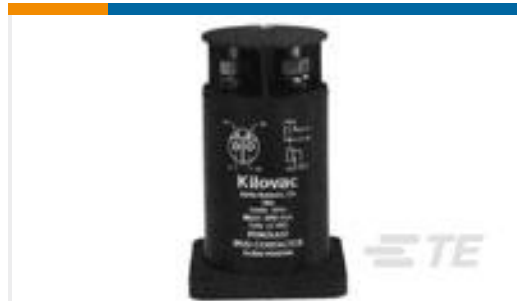
TE 产品编号 7-1618013-3 PD90XB57=RELAY, VACUUM, SPST-N