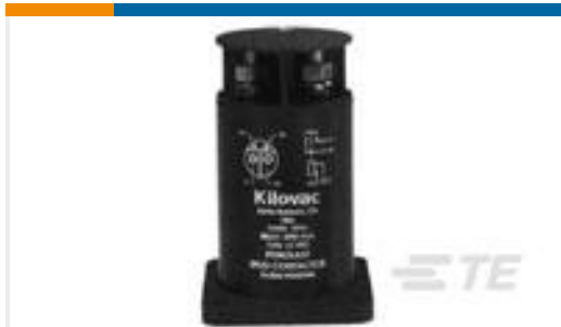
TE 产品编号 7-1618013-2 PD90XA57=RELAY, VACUUM, SPST-N