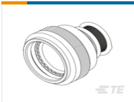
TE 产品编号647053-000 TXR40BW00-2414AI