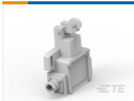
TE 产品编号K1019100 Limit switch GWU-H20-906