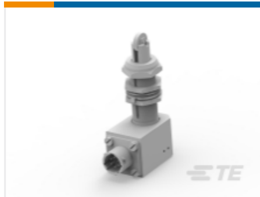
TE 产品编号K1019161 Limit switch G13-01-1365