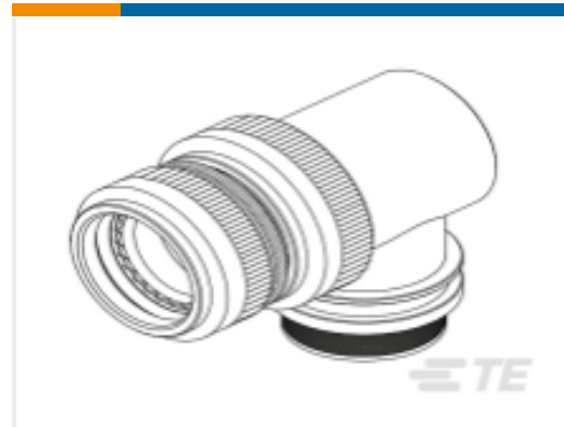
TE 产品编号EK9354-000 STXR40AZ00-0807AI