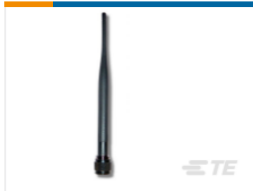
TE 产品编号RD2458-5-RSMA Dipol, RDuck, Fixed, RSMAM 2400-5850MHz, 5dB