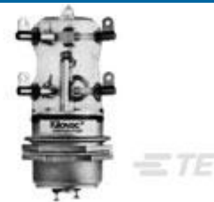
TE 产品编号1-1618273-5 H-16C=RELAY, VACUUM, DPDT