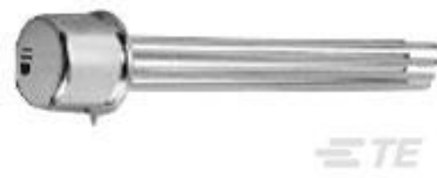
TE 产品编号3-1617118-0 J1MACDD-12XP = M39016/24-028P