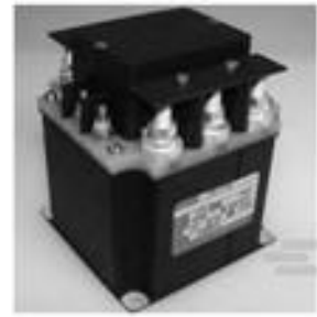
TE 产品编号1616021-6 SA136A=CONTACTOR 3PST N.O. 75