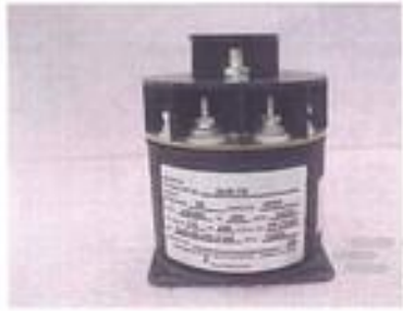
TE 产品编号1-1616037-6 DHR7B=CONTACTOR - 3PDT