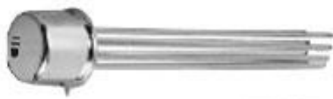
TE 产品编号3-1617118-0 J1MACDD-12XP = M39016/24-028P