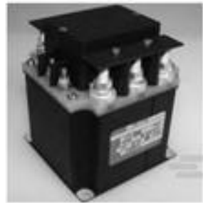
TE 产品编号1616021-6 SA136A=CONTACTOR 3PST N.O. 75