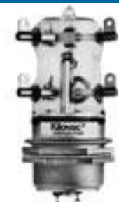
TE 产品编号1-1618273-5 H-16C=RELAY, VACUUM, DPDT