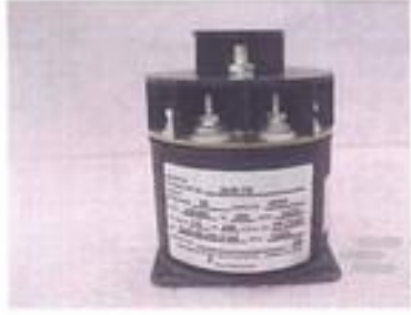
TE 产品编号1-1616037-6 DHR7B=CONTACTOR - 3PDT