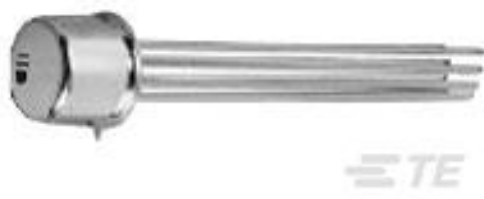
TE 产品编号3-1617118-0 J1MACDD-12XP = M39016/24-028P