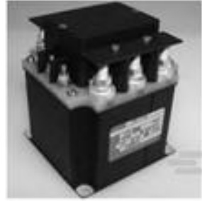
TE 产品编号1616021-6 SA136A=CONTACTOR 3PST N.O. 75