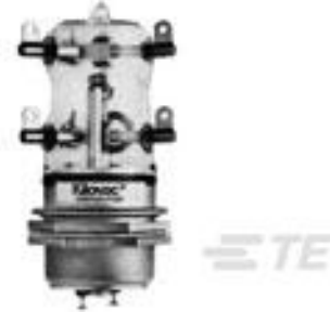
TE 产品编号1-1618273-5 H-16C=RELAY, VACUUM, DPDT