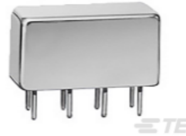
TE 产品编号3-1617536-2 HFW1230F01P=M39016/6-119P