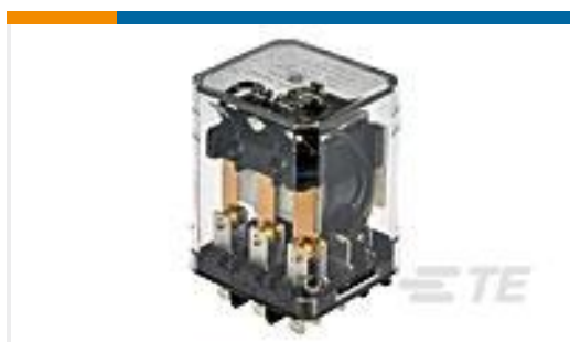
TE 产品编号3-1393118-1 KUP-14D45-110=KU