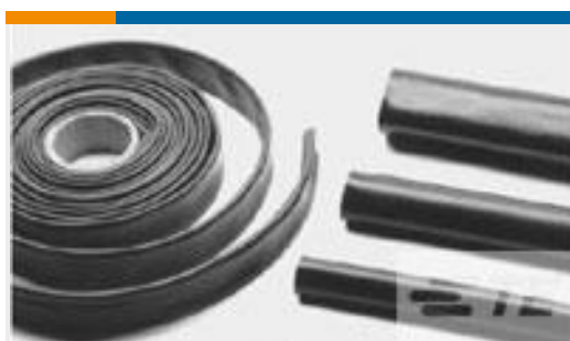
TE 产品编号CB5443-000 XFFR-20X4