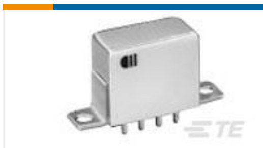
TE 产品编号4-1617004-0 B07D932BC2-0348 = M5757/23-031