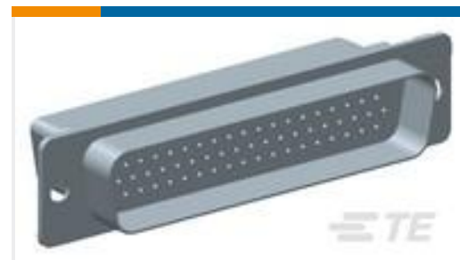
TE 产品编号2101497-5 AMPLIMITE KIT,PLUG,W/IF+GMT,Sz5, 90