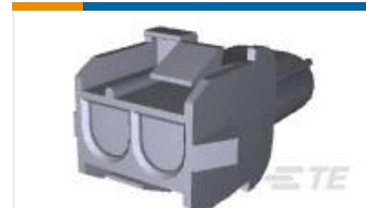
TE 产品编号350778-1 02P UMNL CAP HSG