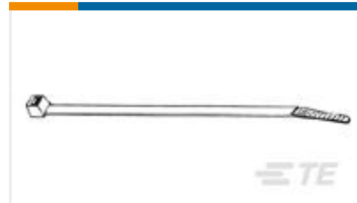
TE 产品编号2-604771-9 CABLE TIE, NATURAL, 4" (1000)