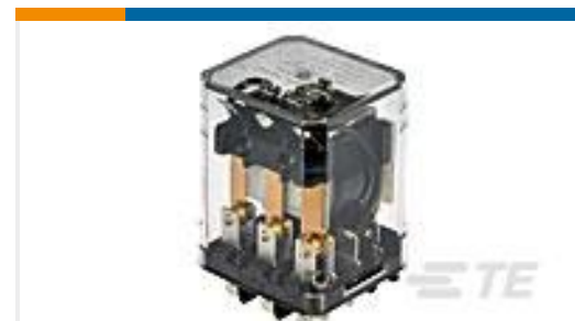
TE 产品编号3-1393118-7 KUP-14D55-12=KU