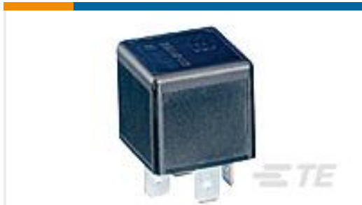
TE 产品编号5-1393302-8 V23134A1052C643-EV-CBOX