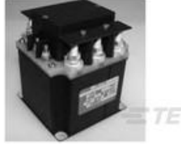
TE 产品编号1616021-6 SA136A=CONTACTOR 3PST N.O. 75