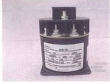
TE 产品编号1-1616037-6 DHR7B=CONTACTOR - 3PDT