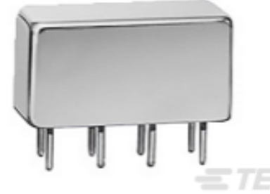
TE 产品编号3-1617536-2 HFW1230F01P=M39016/6-119P