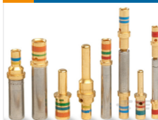
TE 产品编号2562-201-2031L CONT SOC ASSY