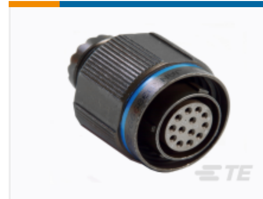
TE 产品编号YDTS26F19-32SAV001 PLUG ASSY