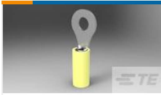
TE 产品编号53073 TERMINAL,PIDG R 26-24 6