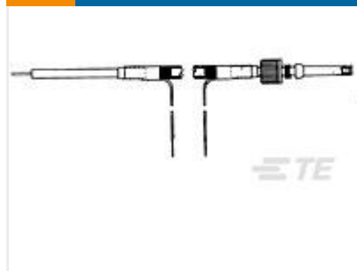
TE 产品编号868235-2 LGH 1/2 SING END SHIELD LEAD