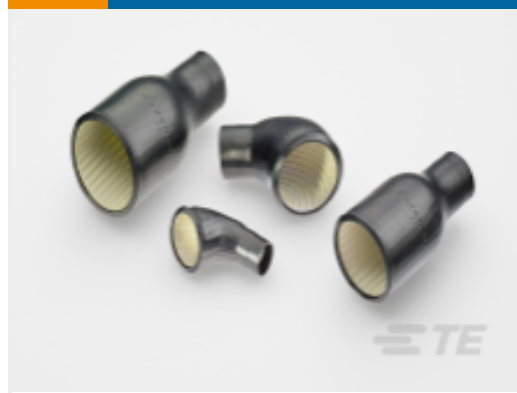
TE 产品编号EK7315-000 222S163-25C-0