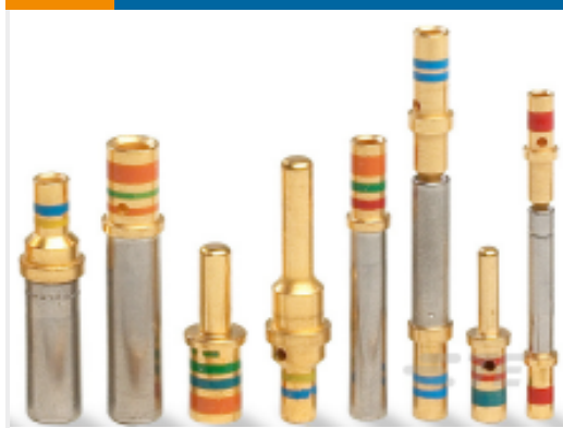
TE 产品编号2560-201-2031L CONT PIN