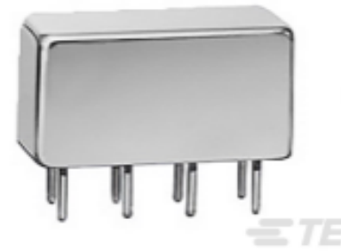
TE 产品编号3-1617536-2 HFW1230F01P=M39016/6-119P