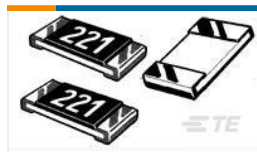
TE 产品编号4-2176070-3 3521 560R 1% 2W