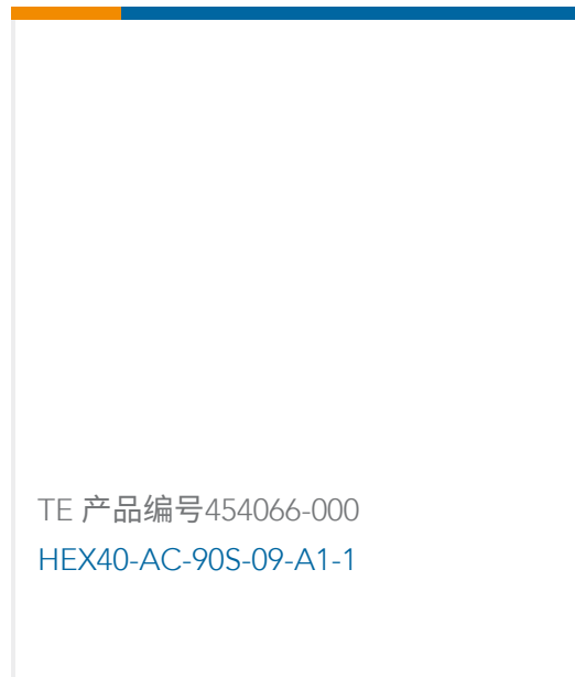
TE 产品编号454066-000 HEX40-AC-90S-09-A1-1