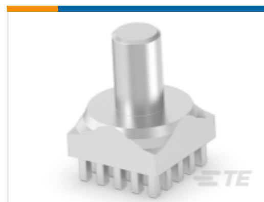
TE 产品编号225678-E POWELM STIFT VOLLM M6 10 2,54 * EP 5,5 *