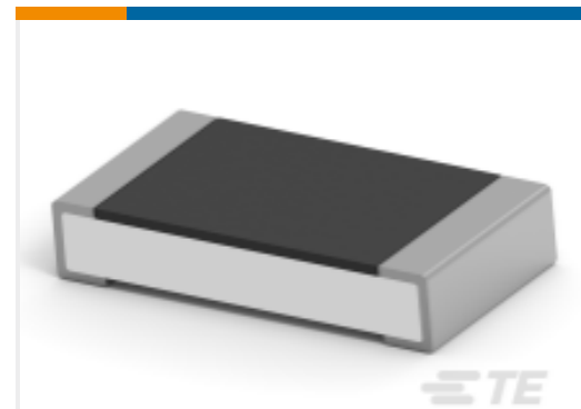
TE 产品编号6-2176390-3 RQ 1206 5K11 0.1% 10PPM 5K RL