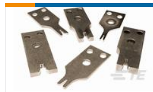
TE 产品编号3-458141-3 CRIMPER, WIRE, SPECIAL (.130)