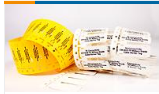
TE 产品编号A47038-000 CM-SCE-TP-1/2-4H-4