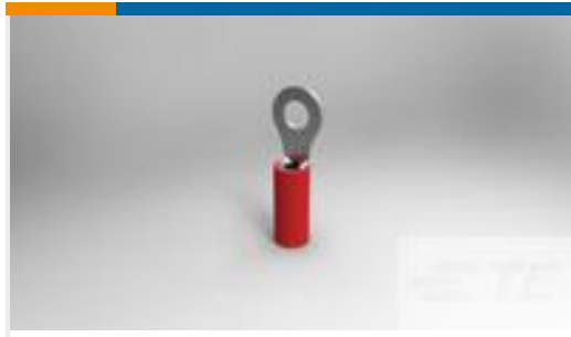
TE 产品编号36149 PIDG R 22-16 COMM 22-18 MIL 6