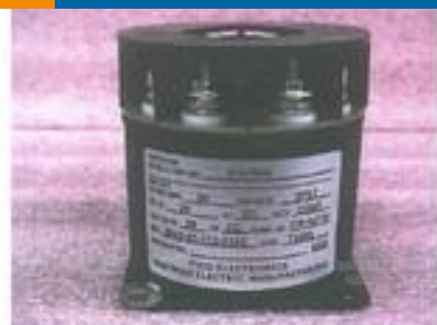
TE 产品编号 1616103-2 DH7MN (FAA/PMA)=RELAY