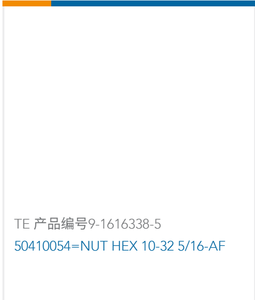
TE 产品编号9-1616338-5 50410054=NUT HEX 10-32 5/16-AF