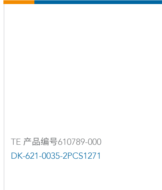
TE 产品编号610789-000 DK-621-0035-2PCS1271