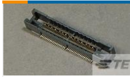
TE 产品编号5767054-2 MICT,RECPT,76,ASSY,PDNI