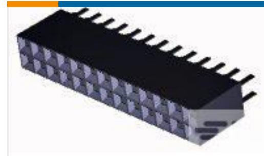
TE 产品编号6-534998-3 26 MODIV VRT DR CE 100/125