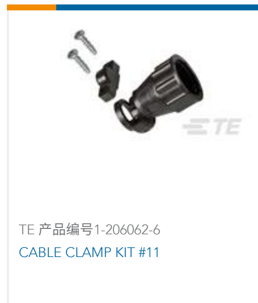
TE 产品编号1-206062-6 CABLE CLAMP KIT #11