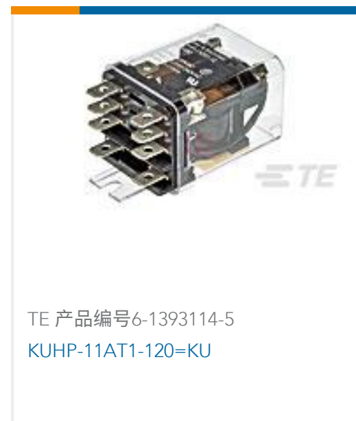
TE 产品编号6-1393114-5 KUHP-11AT1-120=KU