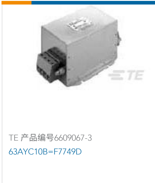
TE 产品编号6609067-3 63AYC10B=F7749D