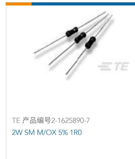
TE 产品编号2-1625890-7 2W SM M/OX 5% 1R0