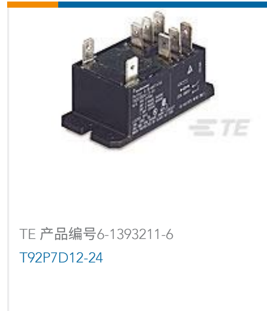
TE 产品编号6-1393211-6 T92P7D12-24