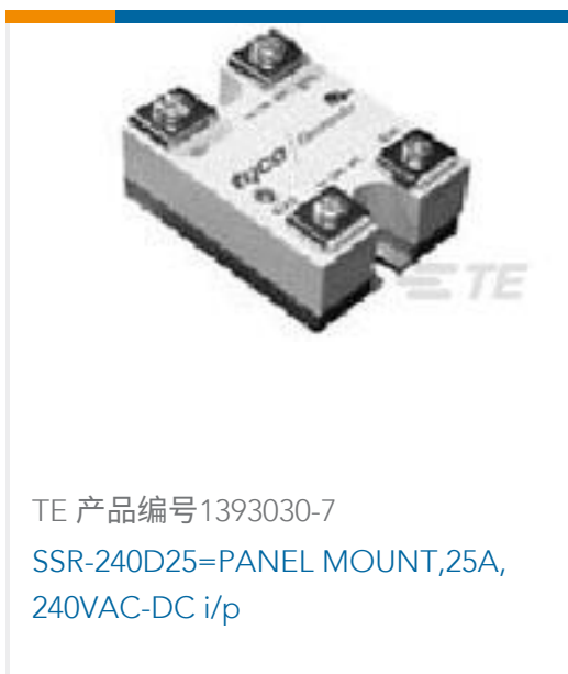
TE 产品编号1393030-7 SSR-240D25= PANEL MOUNT, 25A, 240VAC-DC i/p