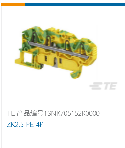
TE 产品编号1SNK705152R0000 ZK2.5-PE-4P