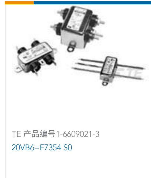
TE 产品编号1-6609021-3 20VB6=F7354 S0