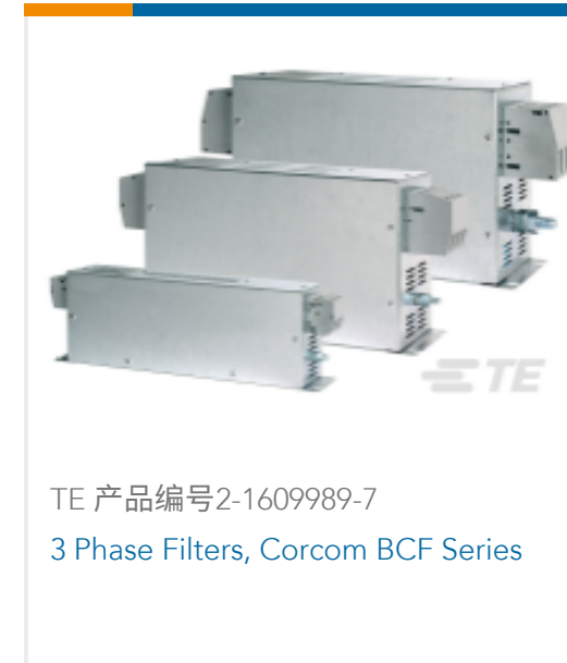
TE 产品编号2-1609989-7 3 Phase Filters, Corcom BCF Series