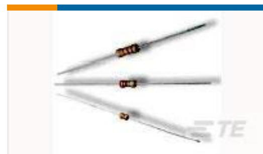
TE 产品编号1623930-3 CFR25 5% 10K