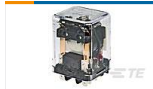
TE 产品编号8-1393113-7 KUEP-11D15-24=KU-