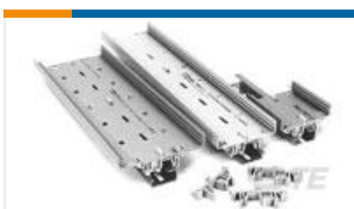
TE 产品编号1-1437685-3 2TK2-48=SNAP TRACK PVC CHANNEL