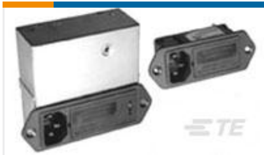
TE 产品编号3-6609129-0 SEFM4SC=F8114