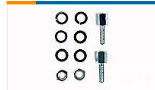
TE 产品编号5205817-3 FEMALE SCREWLOCK KIT