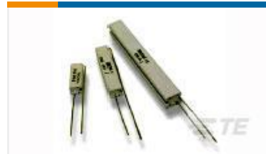
TE 产品编号1623730-2 BCHE 4 W 10R 5%