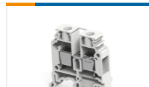
TE 产品编号1SNA115120R1700 M10/10