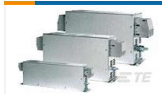
TE 产品编号1609989-5 55BCF10=F8236