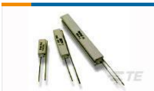
TE 产品编号1623732-2 BCHE 7 W 10K 5%