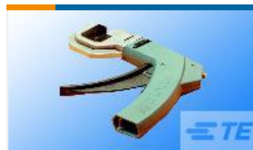
TE 产品编号58246-1 MTA 100 CRIMP HEAD REPAIR DISCRETE