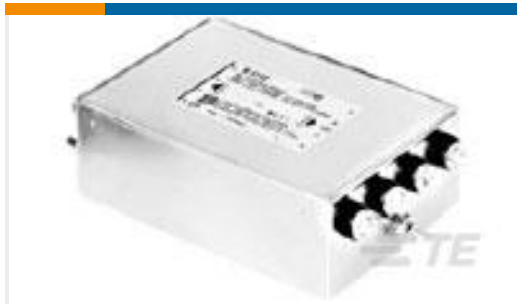
TE 产品编号6609977-2 25AYA6A = F7746A