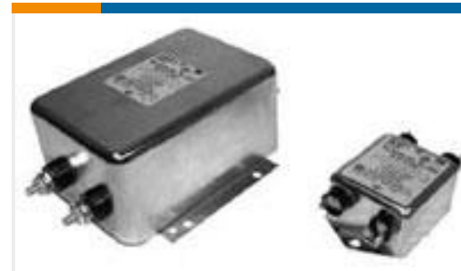
TE 产品编号1-6609037-5 20EMC1=F8130