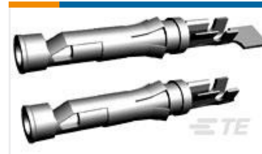
TE 产品编号66565-7 III+ SKT,24-20,TIN,LP