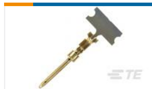
TE 产品编号1658539-3 PIN CONT DUPL PLT LP HD-20 AMP