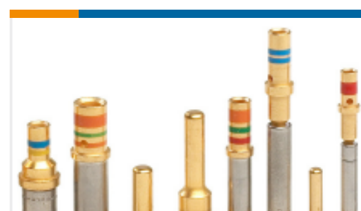
TE 产品编号38946-22L CONT SOC ASSY