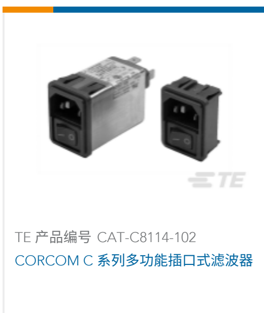
TE 产品编号 CAT-C8114-102 CORCOM C 系列多功能插口式滤波器