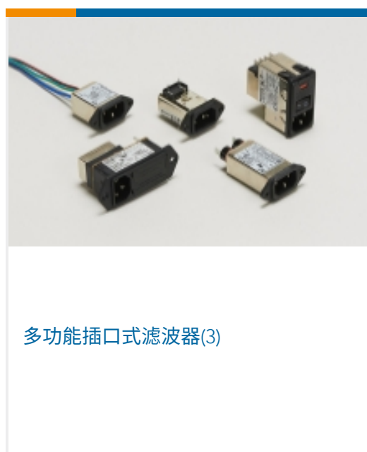
多功能插口式滤波器(3)