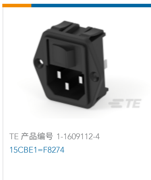
TE 产品编号 1-1609112-4 15CBE1=F8274