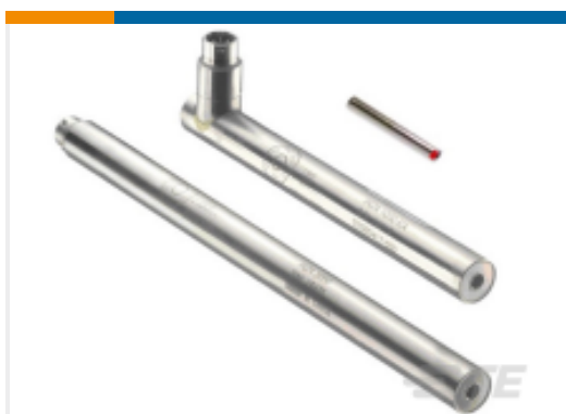
TE 产品编号02560413-000 LVDT HCA 050 ASSY