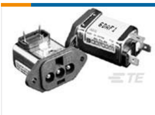
TE 产品编号6609075-7 10DAFP=F7983 S0