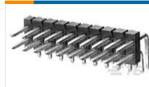
TE 产品编号5-103330-2 04 MODII HDR DRRR B/A .100 CL LF