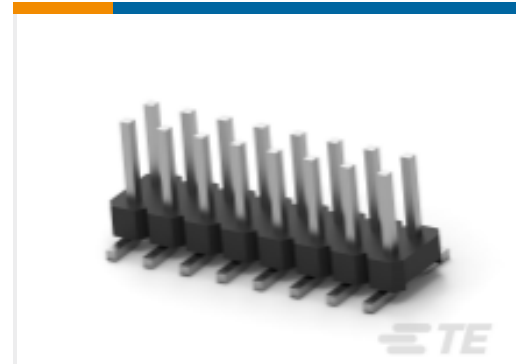
TE 产品编号2842142-7 14P, 2MM, BRK HDR, DRVT, SMD, 0.1AU, TR W/CAP