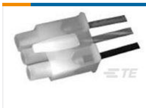
TE 产品编号1609136-2 GA310 DA PLUG ASSY=F6824