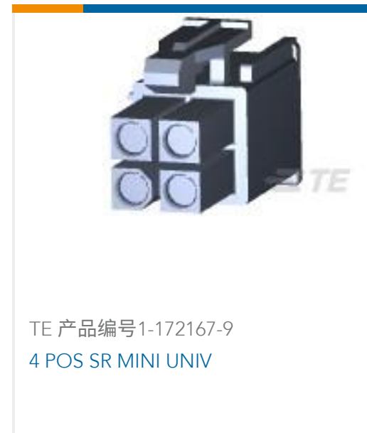
TE 产品编号1-172167-9 4 POS SR MINI UNIV