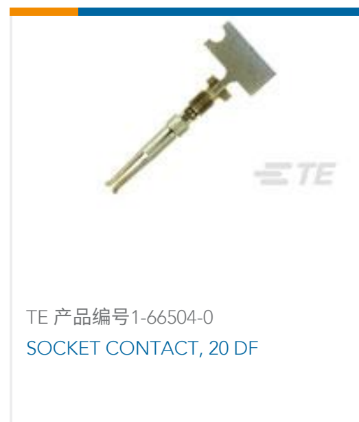
TE 产品编号1-66504-0 SOCKET CONTACT, 20 DF