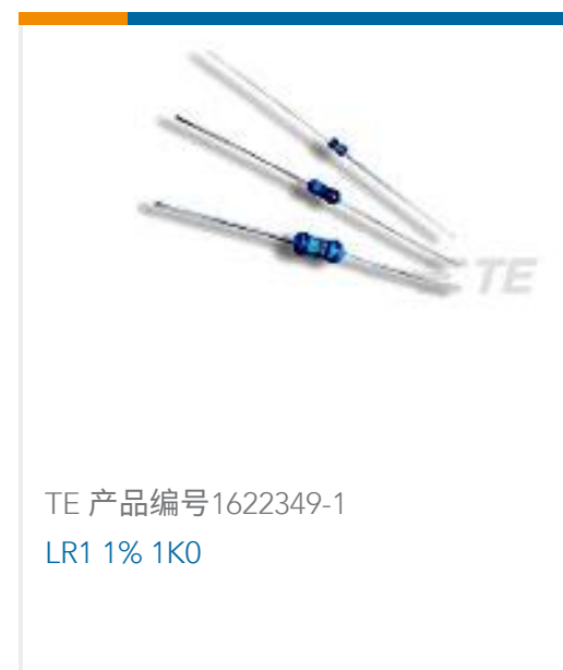
TE 产品编号1622349-1 LR1 1% 1K0