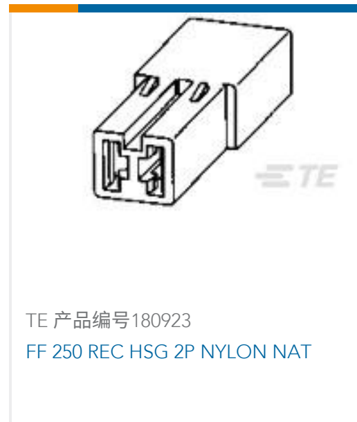
TE 产品编号180923 FF 250 REC HSG 2P NYLON NAT