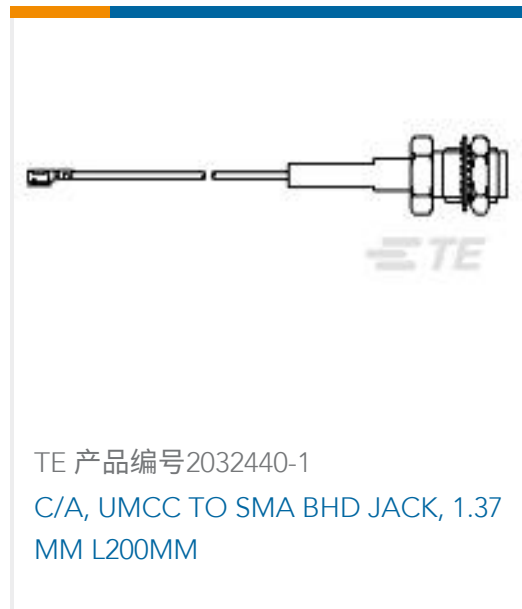
TE 产品编号2032440-1 C/A, UMCC TO SMA BHD JACK, 1.37 MM L200MM