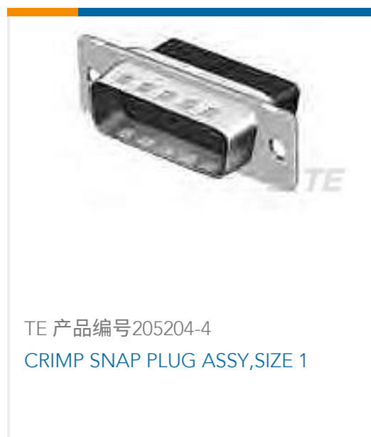
TE 产品编号205204-4 CRIMP SNAP PLUG ASSY, SIZE 1