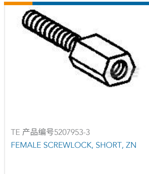
TE 产品编号5207953-3 FEMALE SCREWLOCK, SHORT, ZN