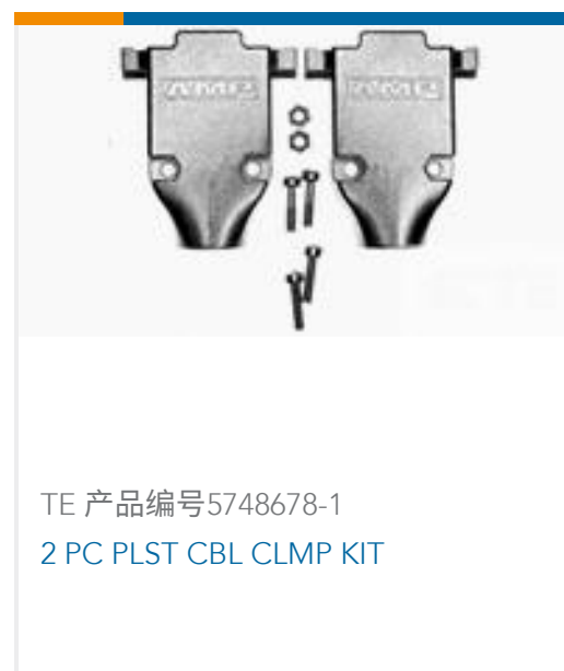
TE 产品编号5748678-1 2 PC PLST CBL CLMP KIT