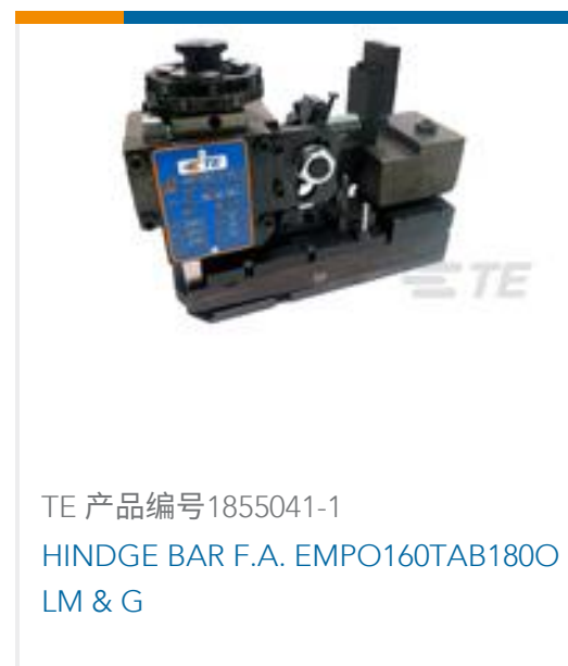
TE 产品编号1855041-1 HINDGE BAR F.A. EMPO160TAB1800 LM & G