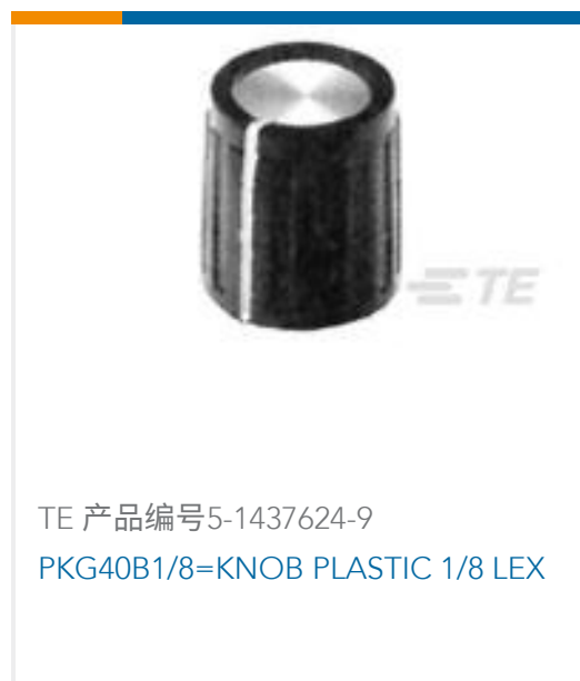
TE 产品编号5-1437624-9 PKG40B1/8=KNOB PLASTIC 1/8 LEX