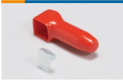
绝缘防护罩和套管(4)