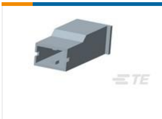
TE 产品编号154719 250 HSG. PL MKI REC. BLACK