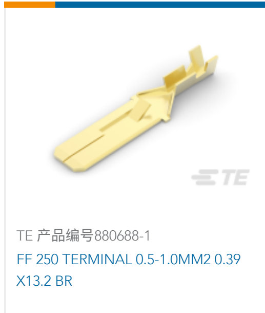
TE 产品编号880688-1 FF 250 TERMINAL 0.5-1.0MM2 0.39 X13.2 BR