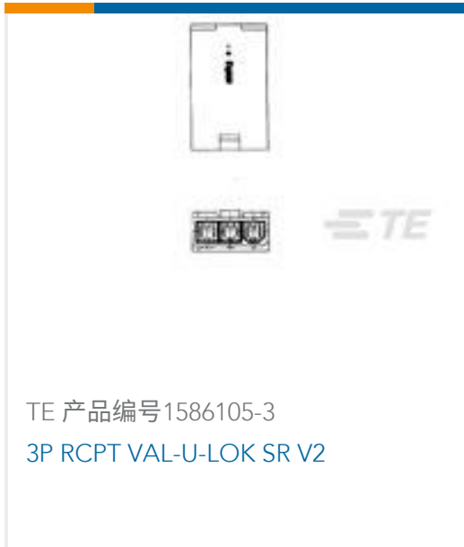
TE 产品编号1586105-3 3P RCPT VAL-U-LOK SR V2