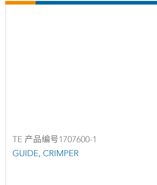
TE 产品编号1707600-1 GUIDE, CRIMPER