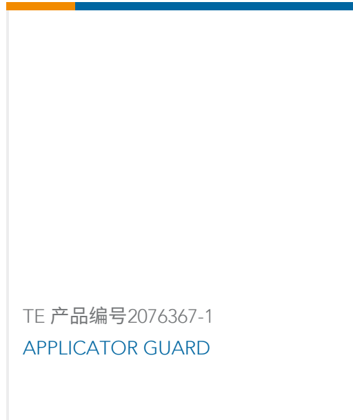
TE 产品编号2076367-1 APPLICATOR GUARD