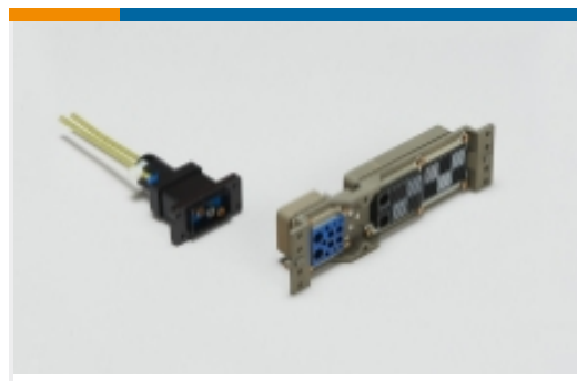
机架和配线架连接器(33)