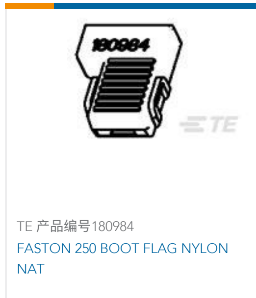
TE 产品编号180984 FASTON 250 BOOT FLAG NYLON NAT