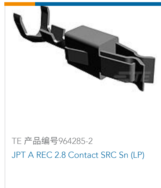
TE 产品编号964285-2 JPT A REC 2.8 Contact SRC Sn (LP)