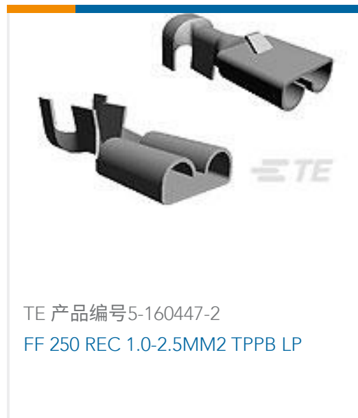
TE 产品编号5-160447-2 FF 250 REC 1.0-2.5MM2 TPPB LP