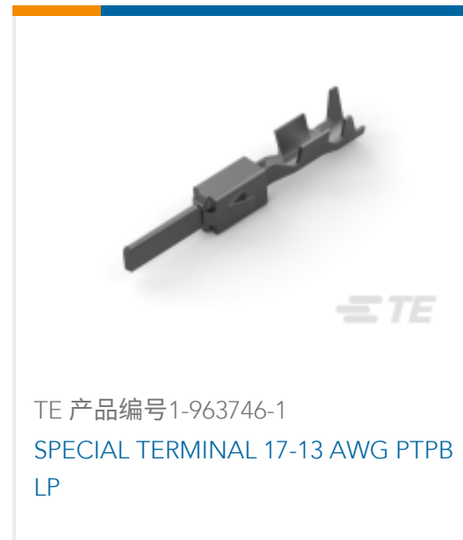
TE 产品编号1-963746-1 SPECIAL TERMINAL 17-13 AWG PTPB LP