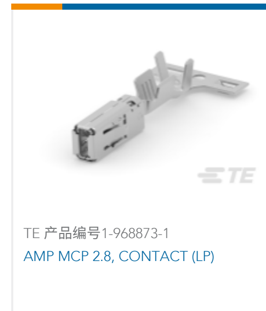
TE 产品编号1-968873-1 AMP MCP 2.8, CONTACT (LP)