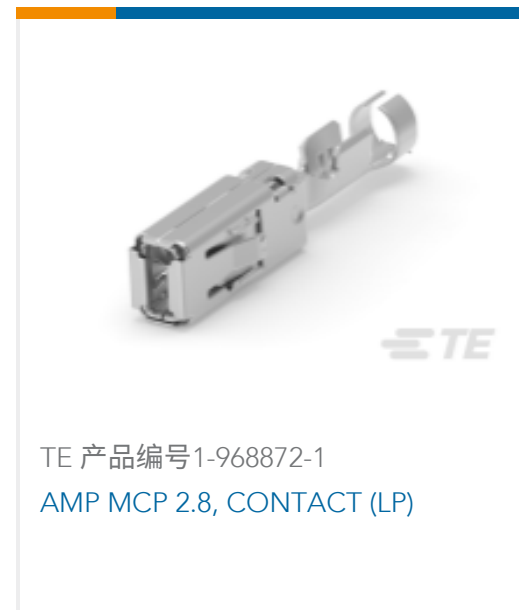
TE 产品编号1-968872-1 AMP MCP 2.8, CONTACT (LP)