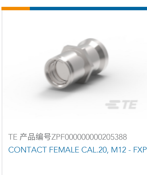
TE 产品编号ZPF000000000205388 CONTACT FEMALE CAL.20, M12 - FXP