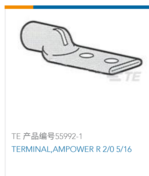
TE 产品编号55992-1 TERMINAL,AMPOWER R 2/0 5/16