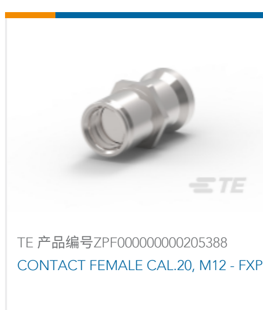
TE 产品编号ZPF000000000205388 CONTACT FEMALE CAL.20, M12 - FXP