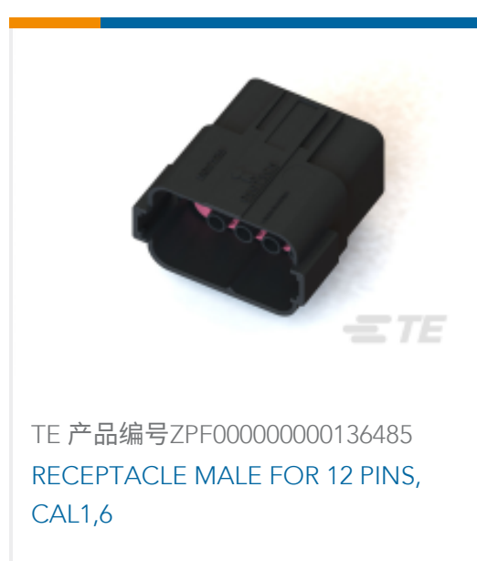
TE 产品编号ZPF000000000136485 RECEPTACLE MALE FOR 12 PINS, CAL1,6