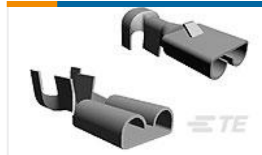
TE 产品编号160366-2 FF 110 SR. REC 22-20AWG TPBR