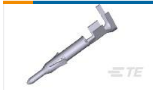
TE 产品编号170364-1 MINI UNIVERSAL M-N-L PIN LP