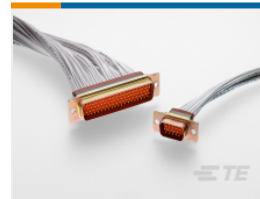
TE 产品编号1-2221860-3 AMPLIMITE IP67,SZ3, 90, 44 POS,IFS, PLUG