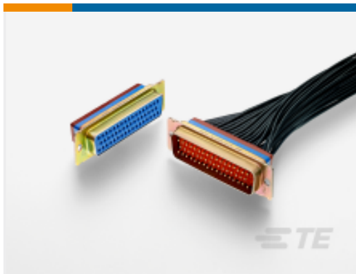
TE 产品编号2157480-2 AMPLIMITE IP67,SZ2, 109, 15 POS,IFS, PLUG