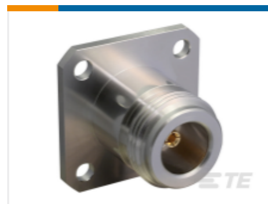
TE 产品编号CONN003-W N Type Jack 50 Ohm Panel Mount