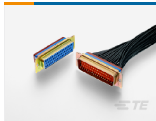
TE 产品编号1-2157481-2 AMPLIMITE IP67, SZ2, 109, 15 POS, RCPT