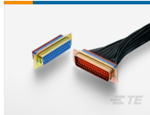
TE 产品编号1-2157481-3 AMPLIMITE IP67, SZ3, 109, 25 POS, RCPT