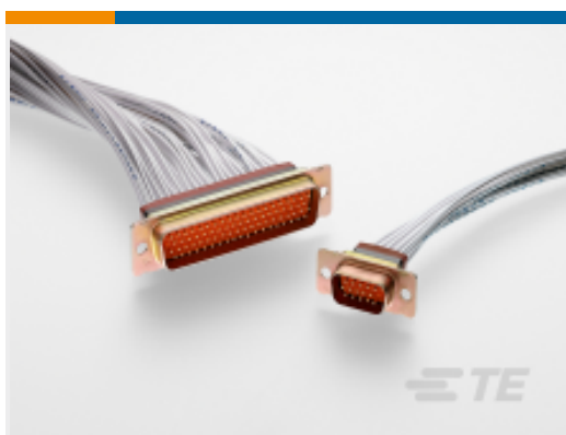
TE 产品编号2221860-1 AMPLIMITE IP67,SZ1, 90, 15 POS,IFS, PLUG