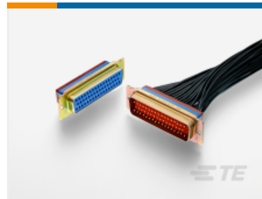
TE 产品编号2157481-1 AMPLIMITE IP67, SZ1, 109, 9 POS, RCPT