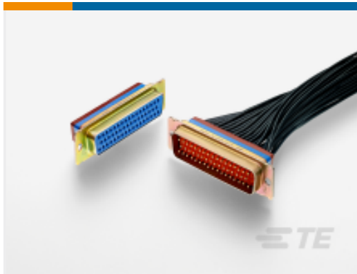
TE 产品编号1-2157480-3 AMPLIMITE IP67,SZ3, 109, 25 POS,IFS, PLUG