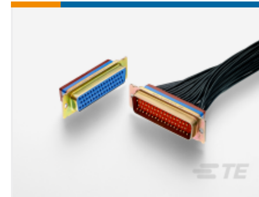
TE 产品编号2157480-1 AMPLIMITE IP67,SZ1, 109, 9 POS,IFS, PLUG