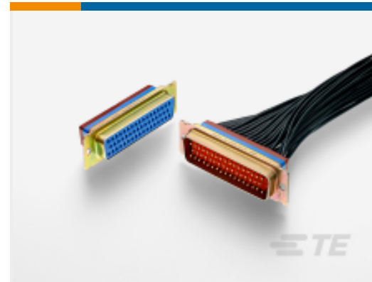
TE 产品编号1-2157480-4 AMPLIMITE IP67,SZ4, 109, 37 POS,IFS, PLUG