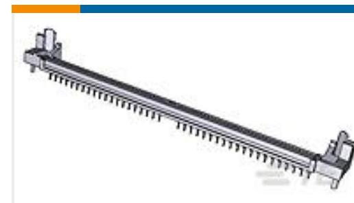
TE 产品编号5822138-4 80 ME .050 L/P AU M/L PB-FREE