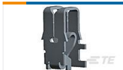
TE 产品编号964339-1 MAG MATE KONT. MKII