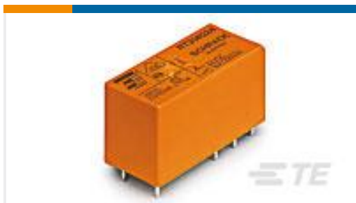
TE 产品编号2-1393243-4 RTE25524