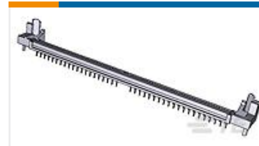
TE 产品编号5822138-4 80 ME .050 L/P AU M/L PB-FREE