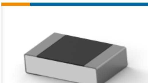
TE 产品编号9-2176374-8 RQ 0805 1K1 0.1% 10PPM 1K RL