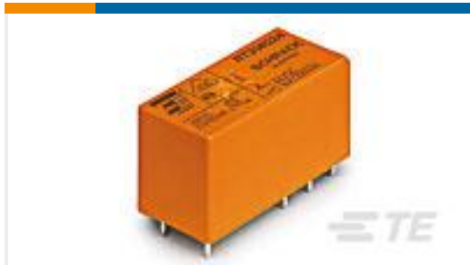
TE 产品编号2-1393243-4 RTE25524