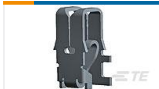
TE 产品编号964339-1 MAG MATE KONT. MKII