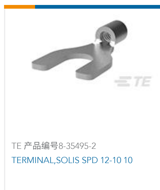
TE 产品编号 8-35495-2 TERMINAL,SOLIS SPD 12-10 10