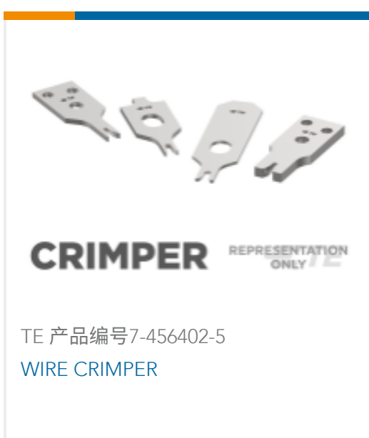
TE 产品编号 7-456402-5 WIRE CRIMPER