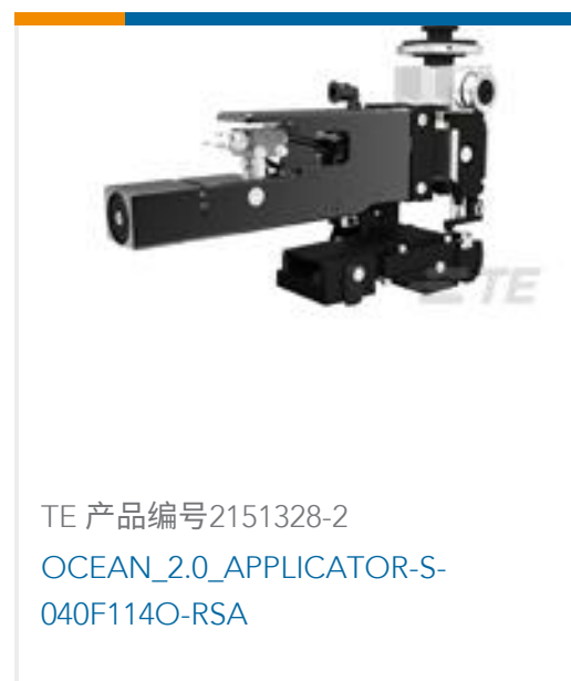
TE 产品编号 2151328-2 OCEAN_2.0_APPLICATOR-S-040F114O-RSA