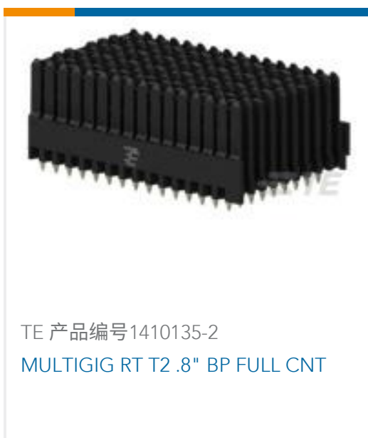
TE 产品编号 1410135-2 MULTIGIG RT T2 .8" BP FULL CNT