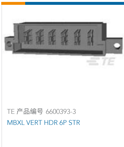
TE 产品编号 6600393-3 MBXL VERT HDR 6P STR