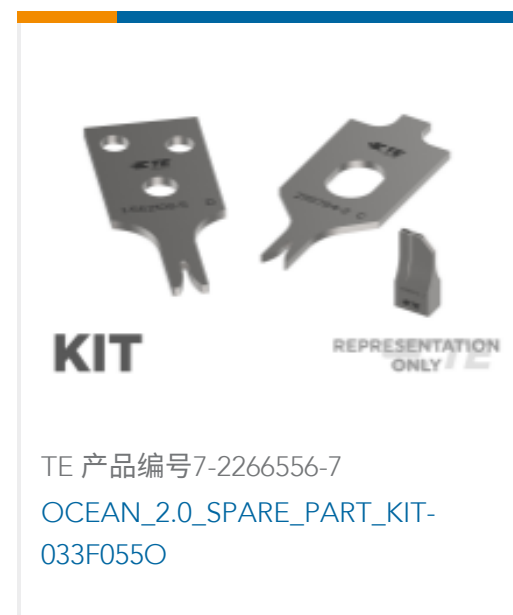
TE 产品编号 7-2266556-7 OCEAN_2.0_SPARE_PART_KIT-033F055O