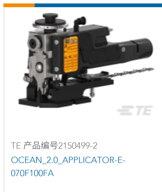
TE 产品编号 2150499-2 OCEAN_2.0_APPLICATOR-E-070F100FA