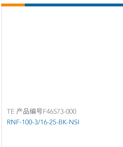
TE 产品编号F46573-000 RNF-100-3/16-25-BK-NSI