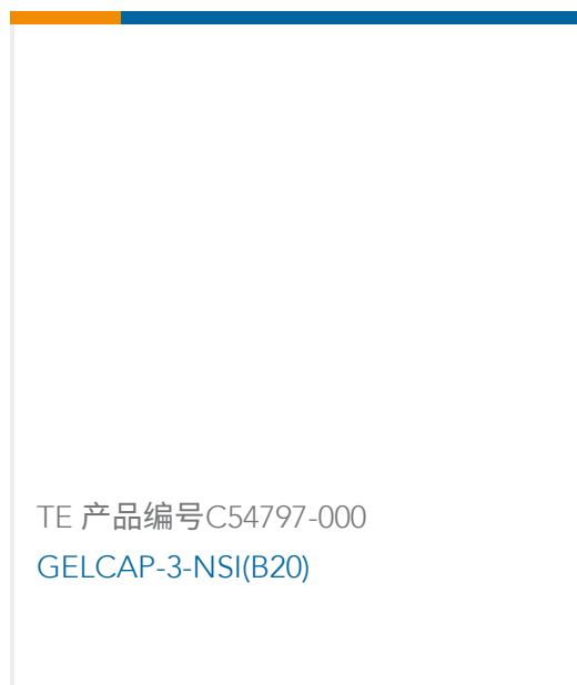
TE 产品编号C54797-000 GELCAP-3-NSI(B20)