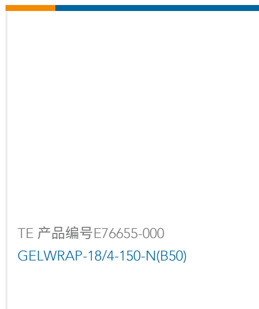
TE 产品编号E76655-000 GELWRAP-18/4-150-N(B50)