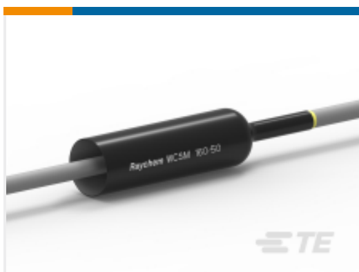
TE 产品编号EE0495-000 厚壁热缩管