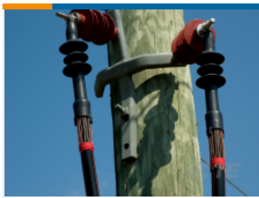
TE 产品编号830433-000 TFT-154E-SG