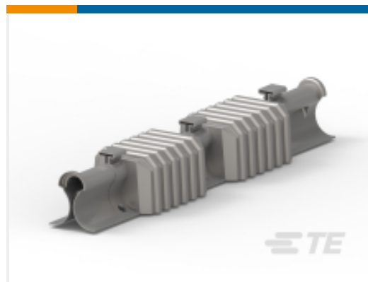
TE 产品编号CU6002-000 电力线路鸟类保护装置