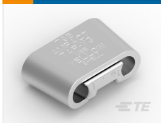
TE 产品编号1443455-3 AMPACT HTT 795.0-636.0