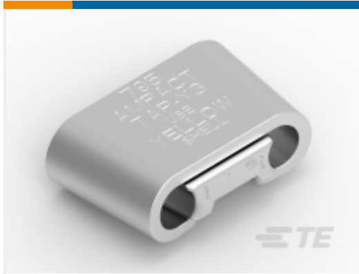
TE 产品编号1443455-1 AMPACT HTT 795.0-795.0