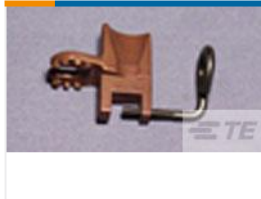
TE 产品编号69900 C & WEDGE HOLDER ASSY