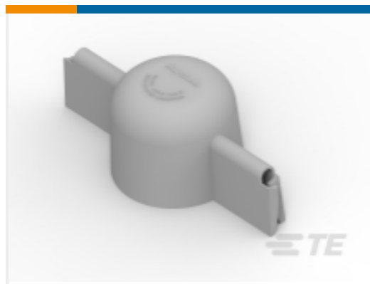
TE 产品编号C85326-000 BCAC-G-ARR-HOT-01(B12)