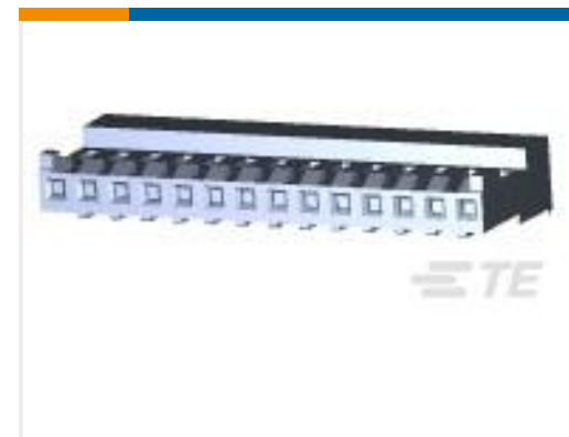
TE 产品编号4-643818-4 14P MTA156 CONN ASSY 20AWG YEL