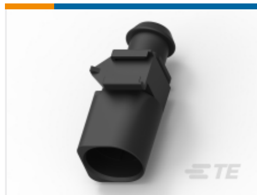
TE 产品编号2-1418510-1 1,6TAB HSG ASSY2X2P RADIAL SEAL