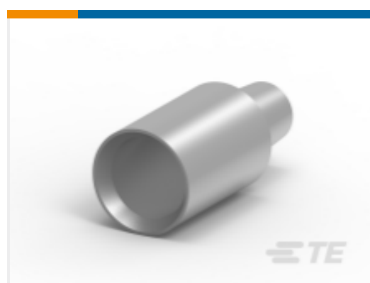
TE 产品编号HC5843 LEAD CONN. FOR HC5840 & HC58