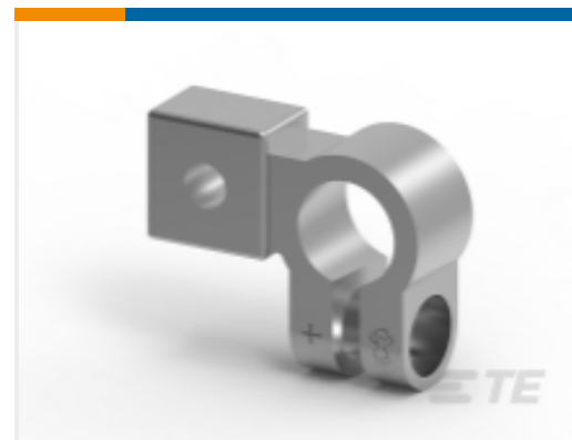
TE 产品编号YHC59020000000000 BATTERY POST CLAMP.+VE.