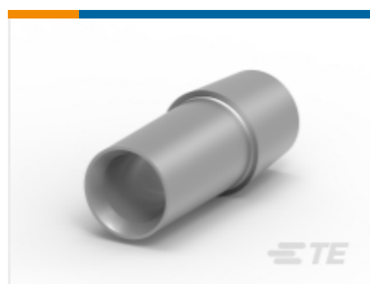
TE 产品编号YHC59320000000000 BATTERY LEAD CONNECTOR.35MM. +VE.M6 THRD.