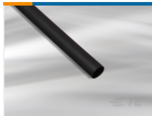
TE 产品编号EM63332001 BATTU 热缩管