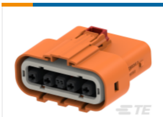
TE 产品编号2343685-1 PLUG ASSY ,HVA280-4PHI