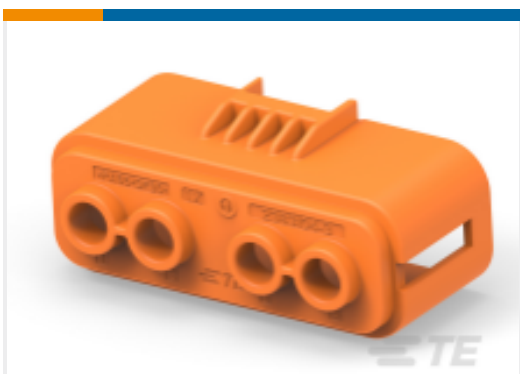
TE 产品编号2383104-3 REC CONN CVR,4POS,AMP MCP 2.8,180DEG