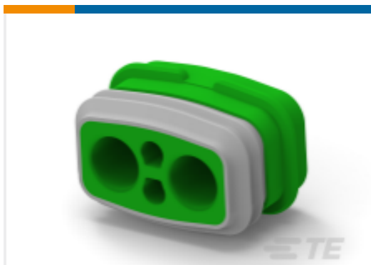
TE 产品编号2103731-3 SPACER-SEAL ASSY,SIZE C,HVA280 2PI SE