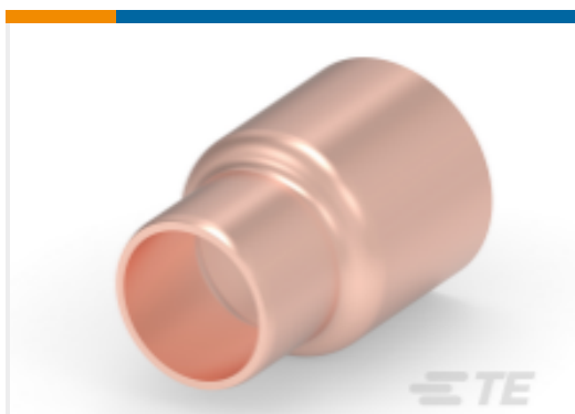
TE 产品编号2350478-2 HVA280 outer ferrule