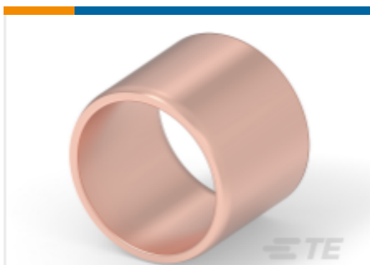
TE 产品编号2350495-2 HVA280 inner ferrule