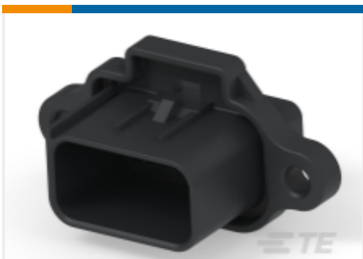
TE 产品编号2005582-2 025 16P SLD CAP ASSY