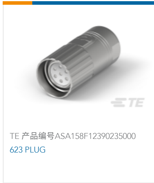
TE 产品编号ASA158F12390235000 623 PLUG