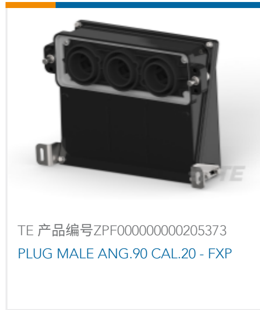
TE 产品编号ZPF000000000205373 PLUG MALE ANG.90 CAL.20 - FXP