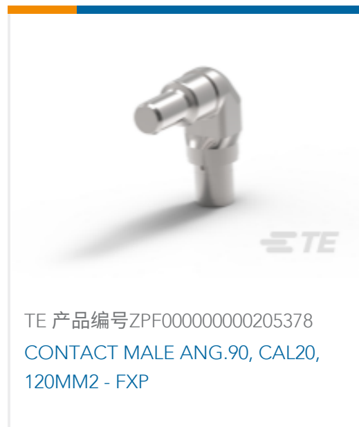
TE 产品编号ZPF000000000205378 CONTACT MALE ANG.90, CAL20, 120MM2 - FXP