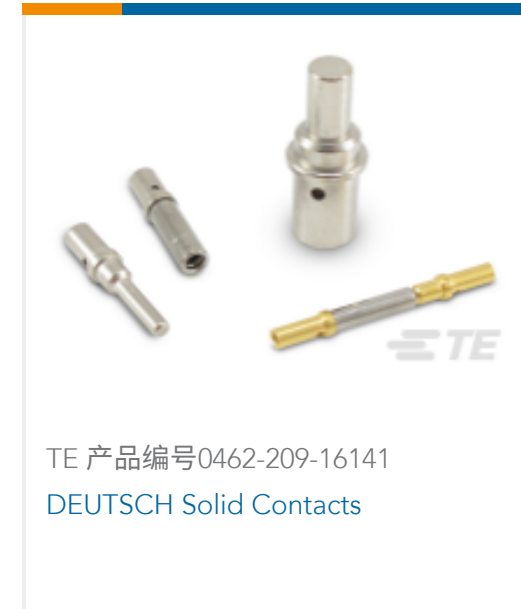
TE 产品编号0462-209-16141 DEUTSCH Solid Contacts