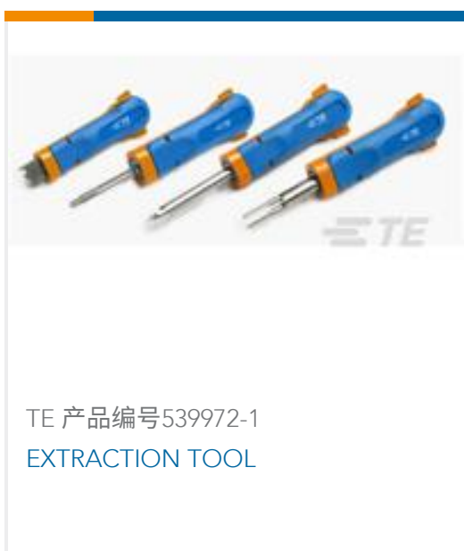
TE 产品编号 539972-1 EXTRACTION TOOL