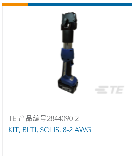
TE 产品编号 2844090-2 KIT, BLTI, SOLIS, 8-2 AWG