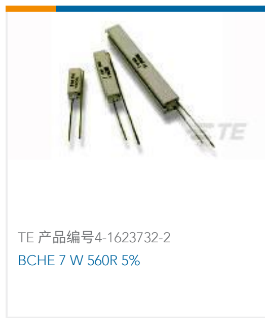
TE 产品编号 4-1623732-2 BCHE 7 W 560R 5%