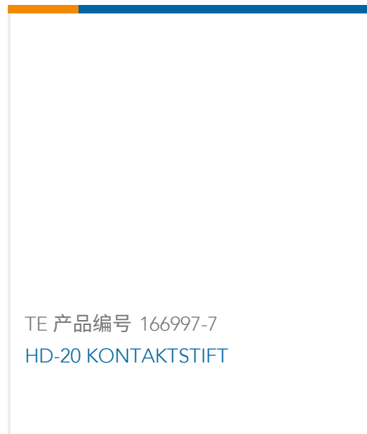
TE 产品编号 166997-7 HD-20 KONTAKTSTIFT