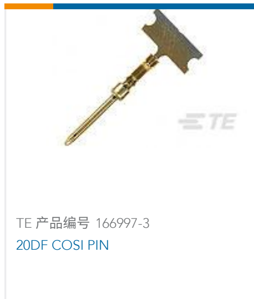
TE 产品编号 166997-3 20DF COSI PIN