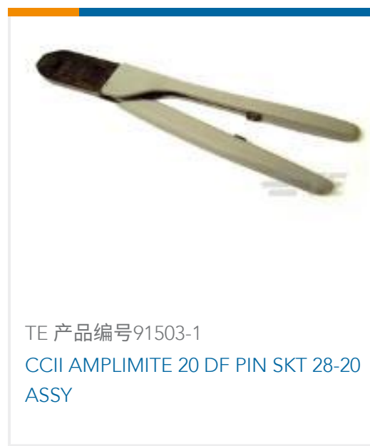
TE 产品编号 91503-1 CCII AMPLIMITE 20 DF PIN SKT 28-20 ASSY