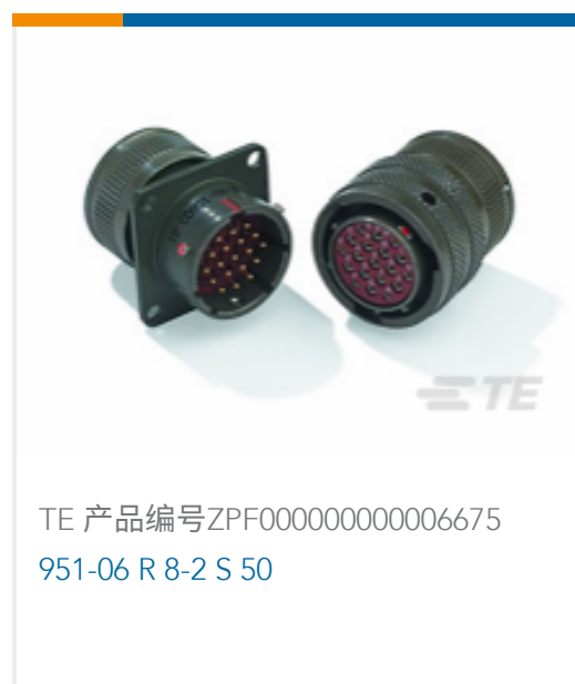
TE 产品编号 ZPF0000000000006675 951-06 R 8-2 S 50