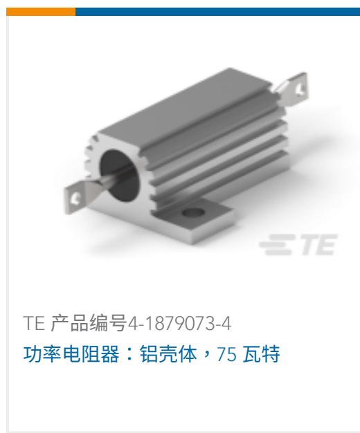
TE 产品编号 4-1879073-4 功率电阻器：铝壳体，75 瓦特