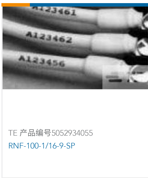
TE 产品编号 5052934055 RNF-100-1/16-9-SP