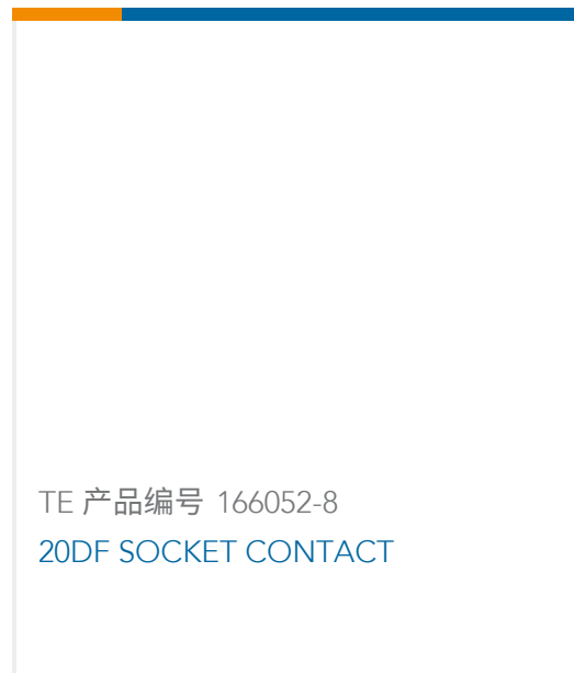
TE 产品编号 166052-8 20DF SOCKET CONTACT