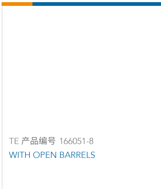
TE 产品编号 166051-8 WITH OPEN BARRELS