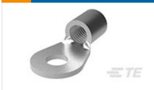
TE 产品编号2-33466-1 SOLISTRAND RING 6 5/16