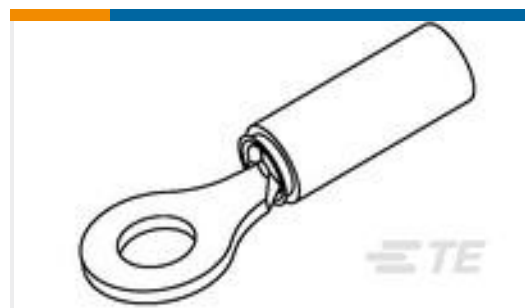
TE 产品编号1577619-1 TERMINAL RT PIDG PEEK STRATO 24-22 AWG