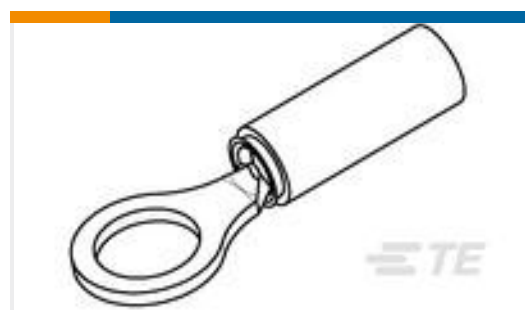
TE 产品编号1577621-1 TERMINAL RT PIDG PEEK STRATO 24-22 AWG