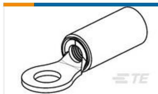
TE 产品编号1577647-1 TERMINAL RT PIDG PEEK STRATO 10 AWG