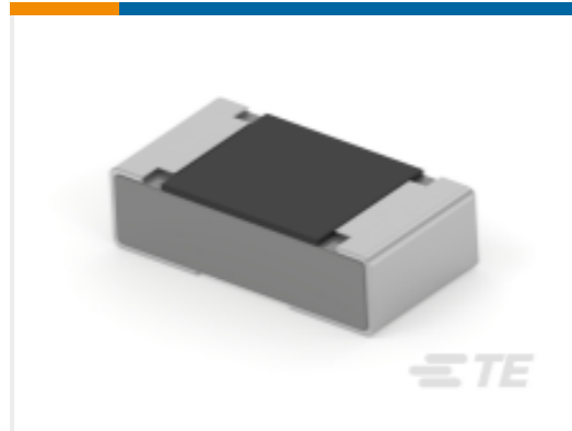
TE 产品编号1-2176473-7 RA73F 1J 75R 0.1% 1K RL