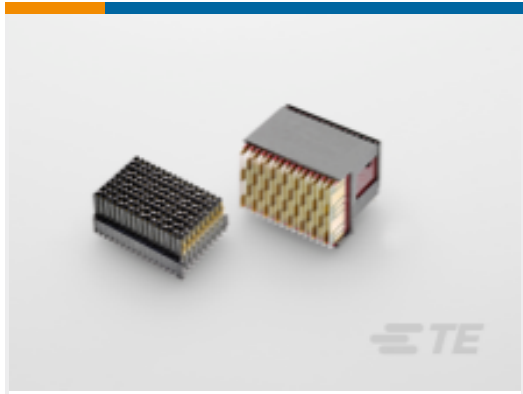
TE 产品编号2302788-1 VERTRECASSY,LEFTEND, HALF, MGRT3