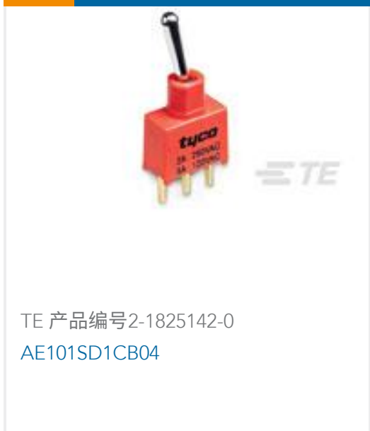
TE 产品编号2-1825142-0 AE101SD1CB04