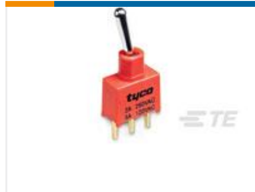
TE 产品编号1-1825143-0 AE201SD1CB04