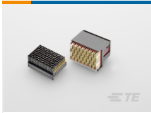
TE 产品编号2302791-1 VERTRECASSY,CENTER,RTM, MULTIGIG RT3