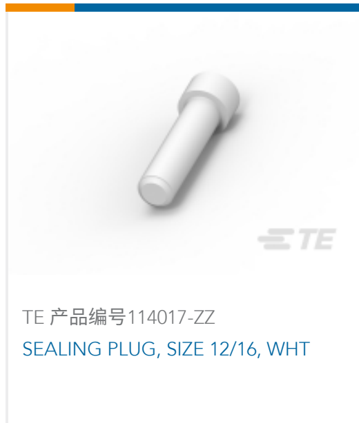
TE 产品编号114017-ZZ SEALING PLUG, SIZE 12/16, WHT