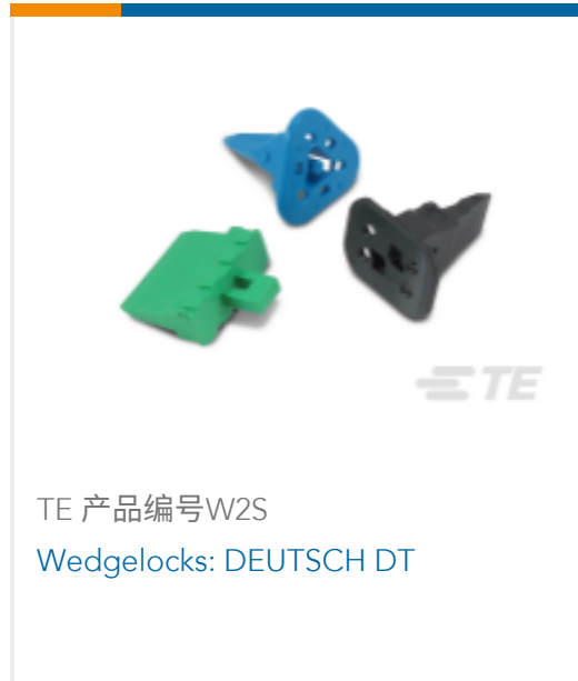
TE 产品编号W2S Wedgelocks: DEUTSCH DT