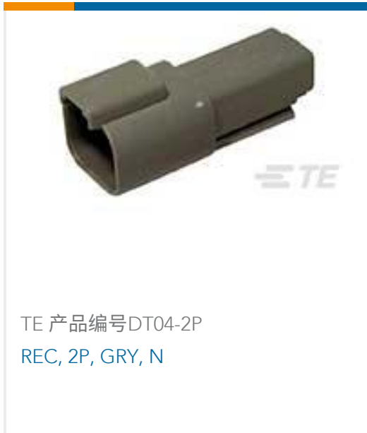
TE 产品编号DT04-2P REC, 2P, GRY, N