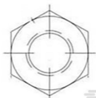
TE 产品编号1-328690-2 JAM NUT, GOLD PLATED