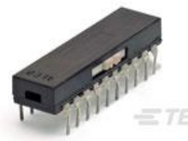
TE 产品编号6-1825011-4 ASF62RG04=6PDT AUTOSLIDE