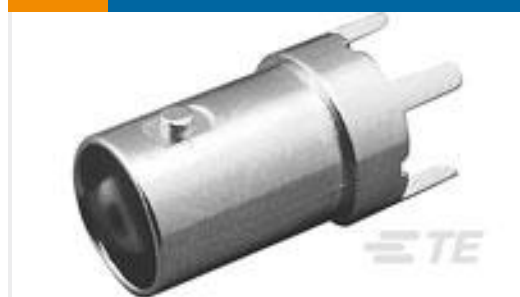
TE 产品编号5222420-1 JACK, VERT, PCB, COML BNC