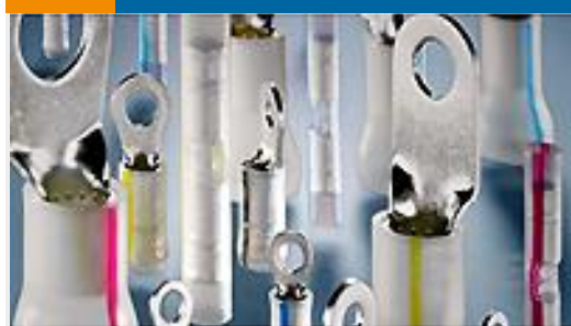
TE 产品编号53418-1 TERMINAL,PIDG PVF2 R 16-14 10