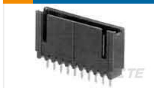
TE 产品编号5-102202-5 08 MODII HDR SRST SHRD LF