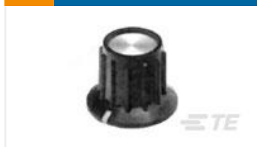
TE 产品编号1-1437624-1 PKA50B1/8=KNOB PLASTIC 1/8 SHA