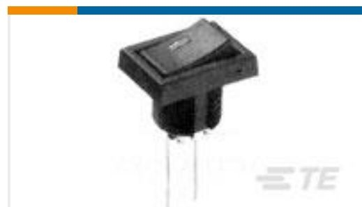
TE 产品编号1825420-2 TRD13F10WL04 rocker switch