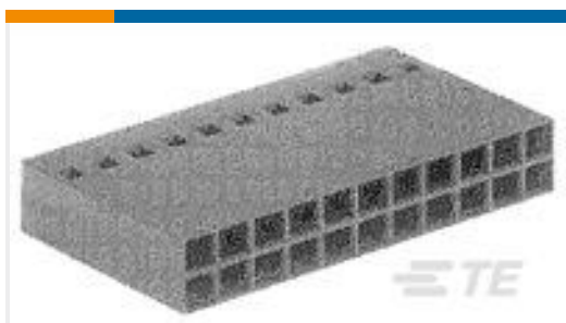
TE 产品编号1-104482-1 26 SHORT PT RCPT HSG DR .100CL